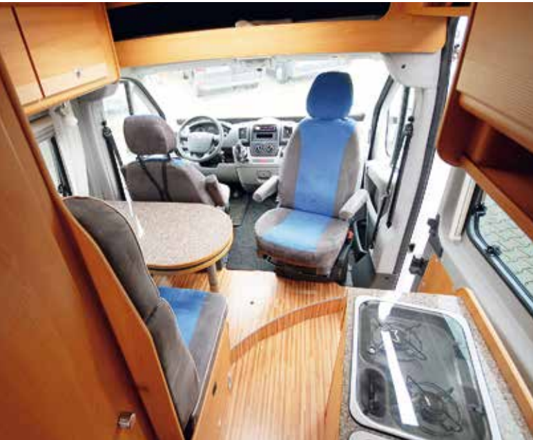
Blick nach vorn: gut gepflegtes Interieur.