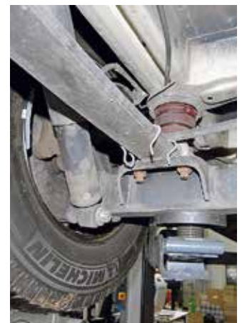
Reifen, Stoßdämpfer, Feder und Feder-element sind in Ordnung (oben rechts).

Unsere Gebrauchtkauf-Checkliste finden Sie unter: www.reisemobil-international.de/praxis/checklisten