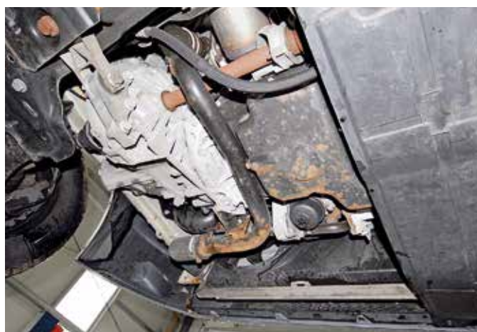
Motor und Getriebe sind rostfrei, dicht und ohne Ölverlust.

Der 2Win aus dem Baujahr 2010 steht einwandfrei da: Die