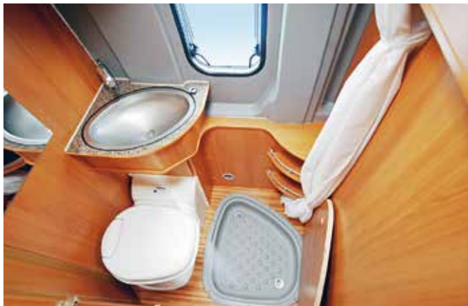
Klein, aber fein: der Sanitärraum. Duschwanne und Raumverfüguung sind gut in Schuss.

getestete 2Win steht – auch dank der guten Pflege des Vorbesitzers – grundsolide und wertstabil da. Möbelbau, Polster und die eingebauten Geräte haben die letzten fünf Jahre praktisch problemlos überstanden. Auch im Sanitärbereich gibt es nichts zu beanstanden. So ist es kein Wunder, dass bei dem momentanen Boom auf dem Markt gebrauchte Pössl nahe am Neupreis angeboten und verkauft werden. Ein gut gepflegter Pössl scheint auch nach fünf und mehr Jahren immer eine gute Wahl.