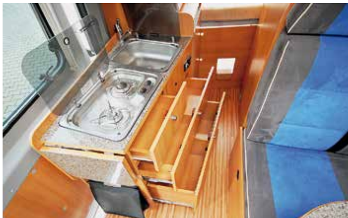
Alles an Bord in der Küche: Kocher, Spüle und Kühlschrank in Topzustand.

tiert hier Händler Brumberg: Es gilt noch eine Werksgarantie von einem Jahr mit Citroën auf die Basis.